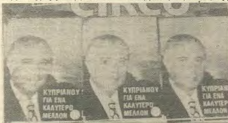
Οι προεκλογικές αφίσσες με τις οποίες γέμισαν τους τοίχους τα μέλη της ΕΛΟΝ και του ΑΚΕΛ με τόση ελπίδα για το μέλλον βρίσκονταν ακόμα κολλημένες όταν ο Κυπριανού ανάγγελλε την μονομερή καταγγελία της Συνεργασίας.